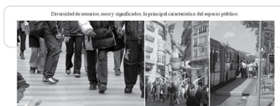
Figuras 4, 5 y 6: Usuarios Rambla de Cataluña, Las Fallas, fiesta de la comunidad Valenciana (temporal) y Punto de parada – acceso al transporte público (permanente).

En definitiva estamos hablando que los Objetos de Uso Público constituyen un hecho funcional, estético, simbólico, que sirve para configurar y otorgar identidad a la ciudad.