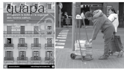
figura 2: Campaña de recuperación de los edificios. Barcelona, España y dispensador de periódicos, Objeto de Uso Público de propiedad privada.

Lo importante es, habilitar el espacio con todos los elementos necesario para apoyar a las personas en las actividades que realizan; un espacio bien dispuesto es un incentivo para su uso.