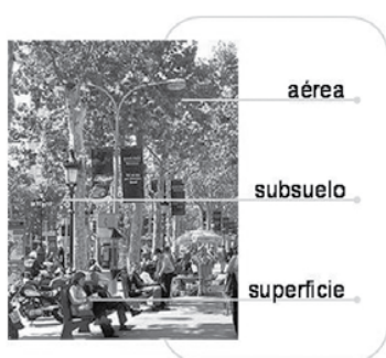
Figura 3: Espacio de actuación del mobiliario urbano.

En cuanto a su instalación, son elementos que pueden ser dispuestos tanto en el plano de superficie, en el subsuelo o en la parte aérea de dicho espacio, pueden ser fijos o móviles y de carácter permanente o temporal (ver figura 3). En este contexto se considera no sólo el mobiliario urbano (bienes), sino también aquéllos que asumen una función de servicio público [Puig, 2003], como es el transporte público, las cloacas o colectores, la red eléctrica, de telefonía, de gas, de agua (servicios) y el paisaje urbano entre otros, que de una u otra manera interactúan con el ciudadano (ver figuras 4, 5 y 6).